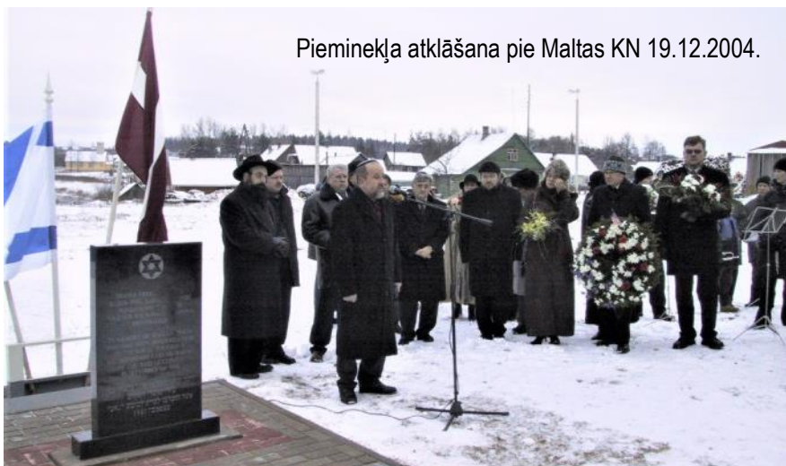
Pieminekļa atklāšana pie Maltas KN 19.12.2004.