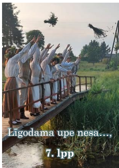
Līgodama upe nesa...,

Līdz 7. jūlijam aicinām pieteikt Maltas pagasta piecgadniekus, kuriem šogad ir Bērņības svētki. Svinīgais pasākums notiks 29. jūlijā plkst. 10.00 Maltas Kultūras namā. Pieteikties pa tālr. 26117782.