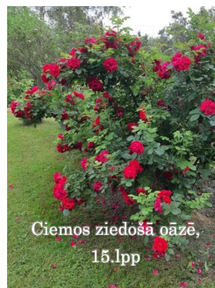
Ciemos ziedošā oāzē,