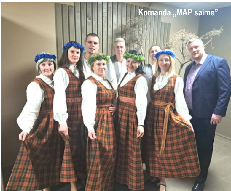
Komanda „MAP saime”