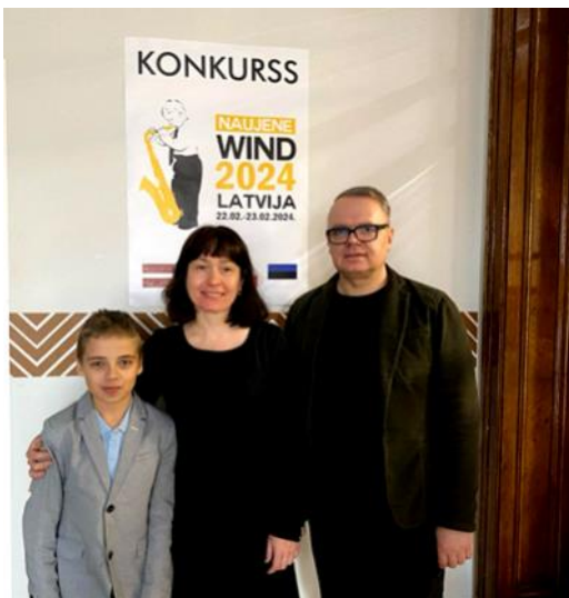
Maltas Mūzikas skolas Pūšaminstrumentu spēles nodaļas koncerta dalībnieki