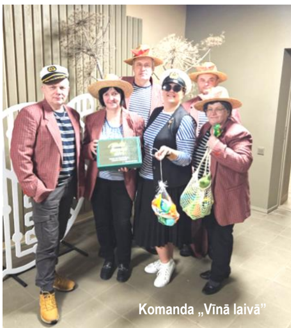
Komanda „Vīnā laivā”