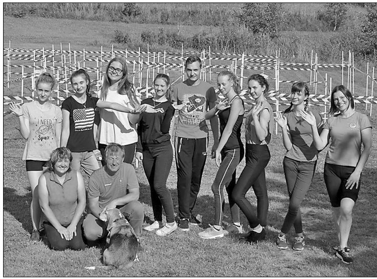
Pašizausmes neformālo apmācību cikla «Mērķē augstāk» dalībnieki